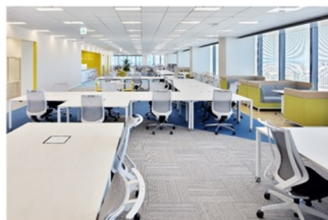
大阪グランフロントオフィス 執務スペース

また、10月より当社社員の約半数にあたるクリエイター約3,000人に対し、既存の制度をさらに充実させ、9つの制度や取組みをパッケージ化したクリエイター活動支援制度「My Polaris（マイポラリス）」を導入します。