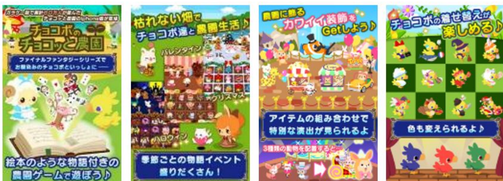
(c) SQUARE ENIX CO., LTD. All Rights Reserved. Developed by SMILE-LAB Co., Ltd.

累計80万人が遊んだチョコットと農園の『Yahoo!ゲーム ゲームプラス』版。『Yahoo!ゲーム ゲームプラス』版だけの新機能として流行のライフケア「歩数計」機能も搭載!歩いて育つ、歩かなくても育つ、絵本のような物語がある農園ゲームです。