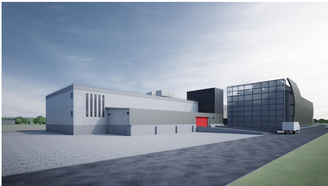
北九州データセンター6号棟完成予想図