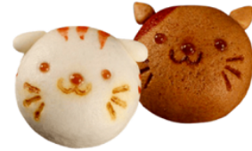
オーガニックサイバーストア 『著積饅頭招き猫 2個』 752円