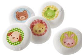
日本ロイヤルガストロ倶楽部 『名入れマシュマロ 5個入』 540円