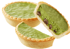
しあわせスイーツ天使のおくりもの 『京都宇治抹茶チーズタルト 4個入』 1,080円

【「Yahoo!ショッピング」で購入できるスイーツ（例）】 ※価格は全て税込。一部商品の価格は変更する可能性があります。