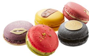
LT BY LOUANGE TOKYO 『マカロンリミテ 5個入』 2,376円