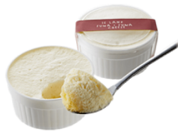
気仙沼さん 『スイーツ「ふわふわチーズ」6個入』 1,935円