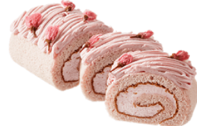
ブランタンブラン by 花月堂 『さくら満開モンブランロール』 2,480円