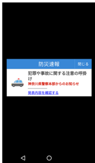
「Yahoo!防災速報」アプリ版の PUSH通知機能による通知例