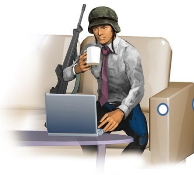
メールとブログもチェックしたし

NHN Japan では、本作のキャッチコピー「メールよし。ブログよし。戦略よーし!」、またキービジュアルデザインに採用されているビジネススタイルのキャラクターから連想させるとおり、20代から30代の社会人を本作のメインターゲットとし、今後、様々な展開を行って参ります。