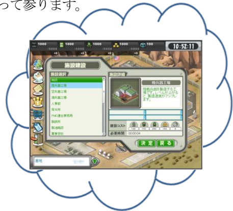
大戦略WEBもチェック!

尚、本日、本作スペシャルサイト ( http://dsweb.hangame.co.jp/lp/ ) を公開致します。