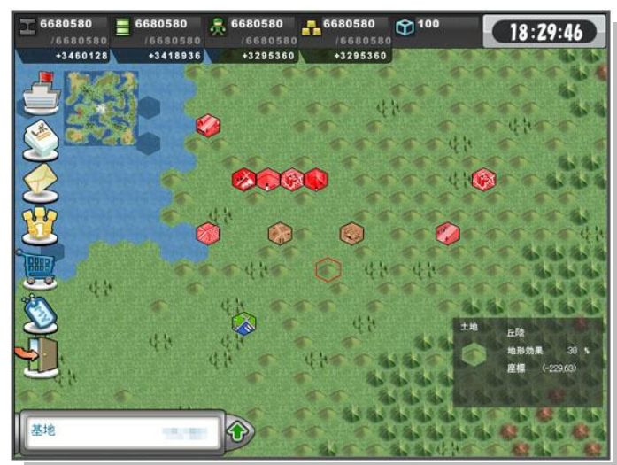
【スクリーンショット】