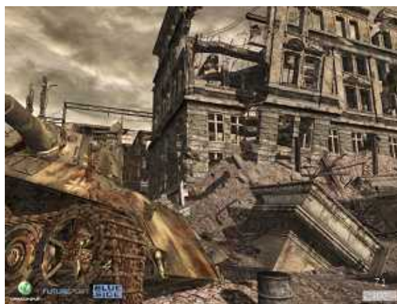
【スクリーンショット】