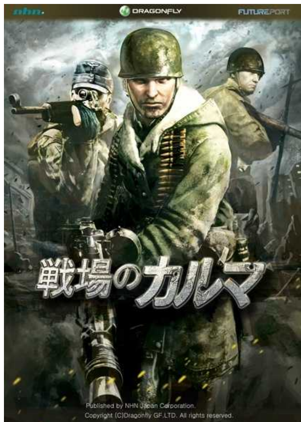
【メインビジュアル】