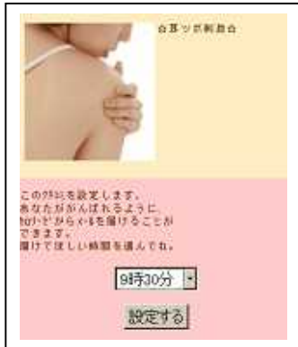
(リマインドメール設定画面)

チャレンジしたいものがみつかったら、「私もやってみる」ボタンを押してチャレンジ登録を行います。(10項目まで登録可能) その際、あらかじめ自分で決めた時間を設定しておくで自分宛にリマインドメールを送ることができます。チャレンジ結果は、リマインドメールからワンクリックで報告完了。報告結果は自動でマイカレンダーに登録されます。 サービスリリース時点では、テキスト形式でのメール配信となります。