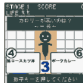
「ダイエット綱渡り」