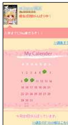
(マイカレンダー画面)

受信したリマインドメールの「がんばった!」ボタンを押すだけで、マイカレンダーにチャレンジした履歴を残すことができます。チャレンジできた日は日付がグローバーマークに変わるので、これまでの状況を簡単に確認することができます。