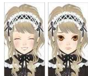
（笑ったとき） （泣いたとき）

笑う・泣く・照れる・驚くなど、6種類の表情が設定できます。『アバターCool』に対応するゲーム（リリース時13種類）では、勝敗によって表情が変化したり、あらかじめ特定のワードを設定しておくことでチャット時も自由に表情を変化させることができます。