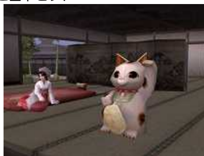
（招き猫家具袋を配置した例）

* スターターチケット Lite / スターターチケットを購入いただくことで製品版へアップグレードされます。