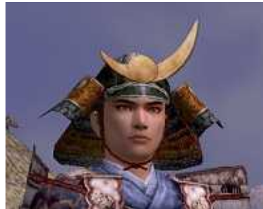
（特製立物「伴芸夢特製立物（ハンゲームトクセイタテモノ）【兜の飾り】）

「茶店娘」から額当てや兜に付けられる特製立物をプレゼント！ 「隠れ里」ではこの方法でしか入手できない、ハンゲーム会員限定の特典です！ （付けている人はハンゲームユーザーという目印にもなります。） ハンゲームの会員登録はもちろん無料！この機会をお見逃しなく！ 特製立物は、取り外しが自由に行えます。