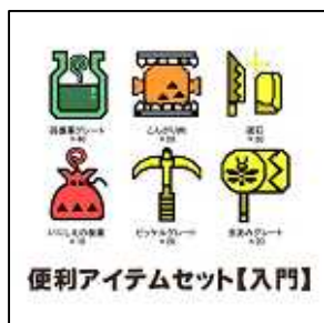
（便利アイテムセット【入門】）

期間中『MHF』の利用登録（トライアルコース）をされた方にもれなくゲーム内アイテム 「便利アイテムセット【入門】」とハンゲームオリジナル「MHFまごころシール」をプレゼント！