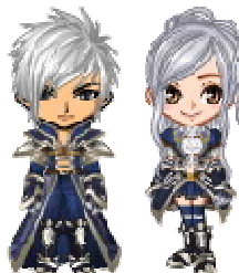
(アバターアイテム「アスールシリーズ」)