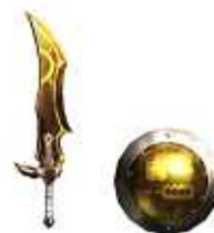
(ゲーム内武器「ベータナイフ【黄】」)

キャンペーン5から8については、ハンゲーム：MHF公式ビギナーサイト上にて後日発表してまいります。 各キャンペーンの詳細は、ハンゲーム：MHF公式ビギナーサイトにてご確認ください。 各キャンペーンの予定日時は変更となる場合がございます。