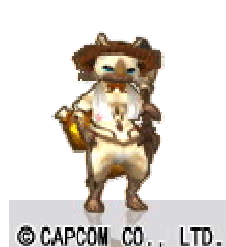
(アバターアイテム「麦わらネコ」)

条件 および の両方を満たした方に上記2種類のアバターアイテムに加え、 ゲーム内武器「ベータナイフ【黄】(片手剣)」をプレゼント！