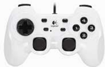
(ロジクールPCゲームコントローラー “スペシャルホワイト”)

『MHF』のプレイにあると便利なゲームパッドを格安で入手！ キャンペーン特別商品として数量限定でMHF推奨ゲームパッドの 特別色「ロジクールPCゲームコントローラー “スペシャルホワイト”」をお得な価格で販売いたします。 キャンペーン特別商品は Amazon.co.jp でのみご購入いただけます。