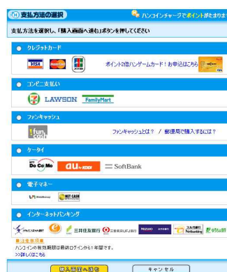
「ハンゲーム」利用画面