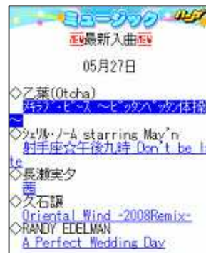
【ミュージック詳細画面】