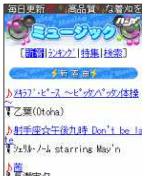
【ミュージックトップ画面】