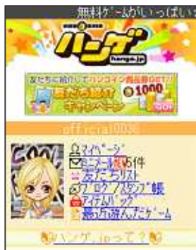
【ハンゲ.jpトップ画面】