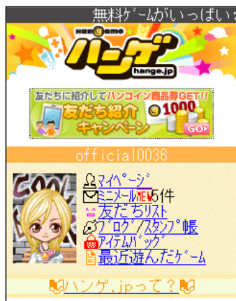
【ハンゲ.jpトップ画面】