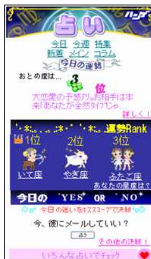
【ハンゲ.jp占いトップ画面】